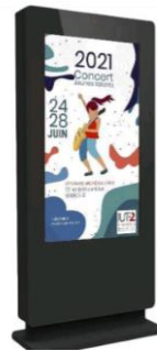
Totem (tactile ou non) fixé au sol