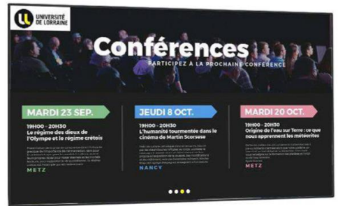
Écran Mural (tactile ou non)